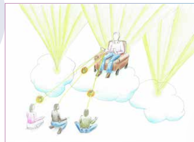
Peter siddende på en sky i himlen, hvor han formidler den rette energi til modtagerne.